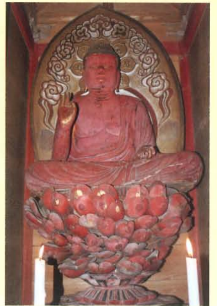
川中神社木造阿弥陀如来坐像

製作年代は不明ですが、室町時代のものであると伝えられています。県内でも貴重なものであるため、県の有形文化財に指定され大切に保存されています。