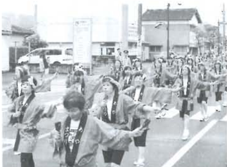
※まつりの詳細については、7月に広報・チラシ等でご案内します。