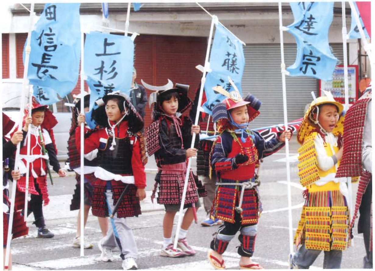
男山まつり 手作りの鎧兜を着た子ども達が、勇壮な姿で商店街をパレードしました。 (5月2日撮影)