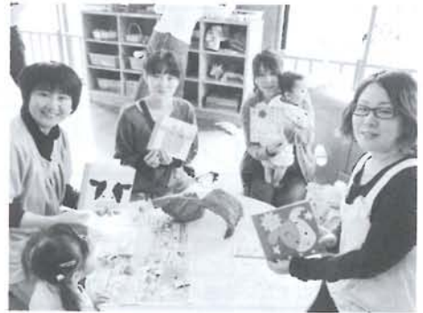
親子教室「コアラ」アルバム作り