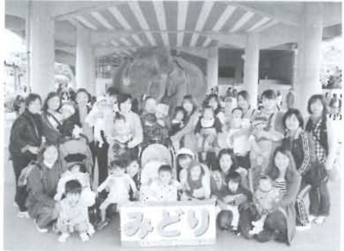
綾っ子広場「動物園」

「知っている」と「知らない」とでは大きな差があります。いざという時に対応できますか？