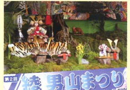
「男山」(小野金物店にて撮影)

6月は、 町県民税1期、 国民健康保険税2期 の納期です。 納期限は 6月30日(水) です。