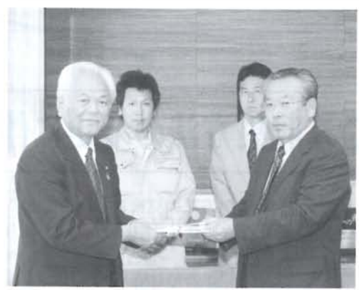
溝口建設様より寄贈