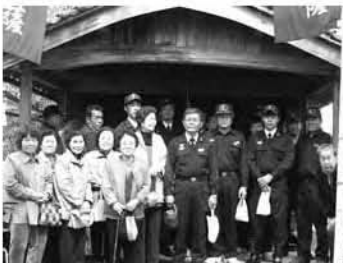
東中坪綾中地藏尊春の大祭 火除けの神様として知られています。火の元にもしっかりと気をつけましょう。