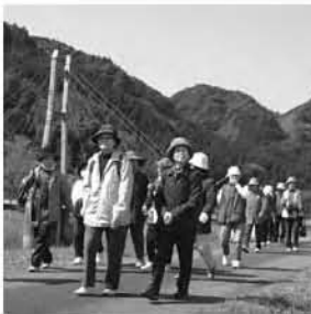
3/11(木) ヘルスアップウォーキングが開催され82名が心地よい汗を流しました。

*生活保護・町民税非課税世帯の方は引き続き公費補助があり無料です。 (健康センターで発行する生活保護・町民税非課税世帯確認証が必要です。)