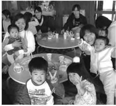
ゆったり子育て教室