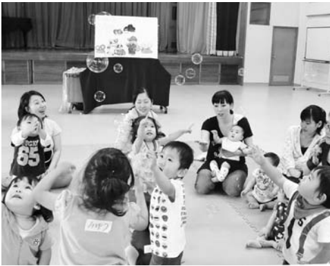
親子教室「コアラ」～ふれあい遊び