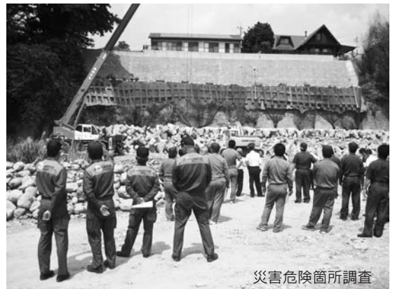
災害危険箇所調査

地域の公民館などにある「土砂災害危険区域図」に表示のある危険個所を確認しておきましょう。また、「急傾斜地崩壊危険箇所」の表示柱が設置されている地域の方は特に注意が必要です。