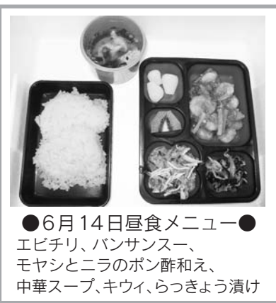
●6月14日昼食メニュー● エビチリ、バンサンスー、モヤシとニラのポン酢和え、中華スープ、キウイ、らっきょう漬け

対象 65歳以上のひとり暮らし及び高齢者世帯の方、障がい者など詳しくは、お問い合わせ下さい。 利用料 一食 四〇〇円