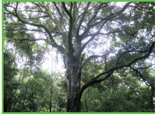
樹齢およそ250年イチイガシ