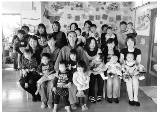
ゆったり子育て教室