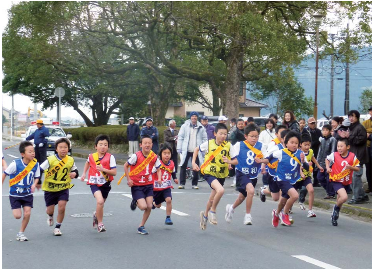
第44回新春こども駅伝大会 新春子ども駅伝大会が開催され、町内子ども会から14チームが参加しました。厳しい寒さの中、子ども達は元気よく走り抜いていました。 (1月9日(日)撮影)