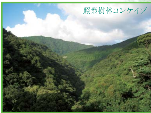
照葉樹林コンケイブ