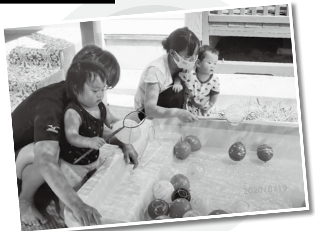
ゆったり子育て教室「おまつりごっこ」