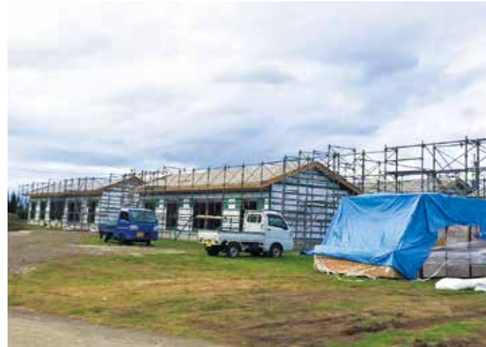
建設中の仮設住宅

と町の人々が訪れます。「自宅が浸水して生活できないが、なんとか2階で過ごしている」「被災した自宅をこの先どうしたらいいのか」「トイレもお風呂もまだ使えない」。なかなか戻らない日常生活に対する不安や体調面の心配、家族や自宅を失くした悲しみ。人々の顔には疲労が色濃く刻まれていました。