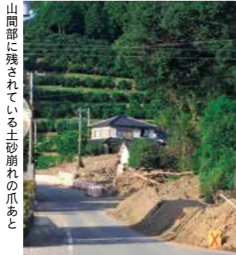
山間部に残されている土砂崩れの爪あと

中、災害が起こった場合に何が重要かを考え続けました。「深夜に近所の人が増水した川の様子を連絡してくれたおかげで、命が救われた」「こんなことが起こるなんて想像もしていなかった」「この町に住み続けたいが自宅が全壊して途方に暮れている」「人工透析のため通院が必要だが、病院のバスは仮設住宅まで送迎できないというので仮設住宅の申し込みを悩んでいる」。芦北町の人々の声は今も鮮明によみがえります。