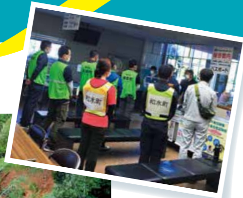
朝礼で情報を共有する災害派遣職員

して住み続けるのか、解体して立て直すのか、あるいは町を離れるのか悩む悲痛な話を多くの住民から聞きました。さらに、福祉事業所も被災したために多くの高齢者が行き場を失ってしまいました。日常にはまだ遠い、先が見えない深刻な状況でした。