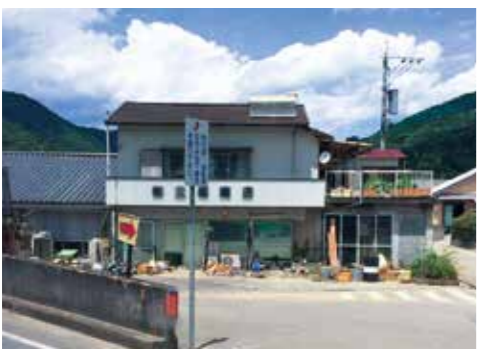
中心部の店舗や住宅の前には未だ災害ごみがある

なか届かないことも想定し家庭で必要最低限の水や食料、救急用品などを備蓄しておくこと。災害が起こる可能性がある時は川の水位や気象予報、防災行政無線などの情報を収集し、早めの避難を意識することが人的被害を抑えるのです。