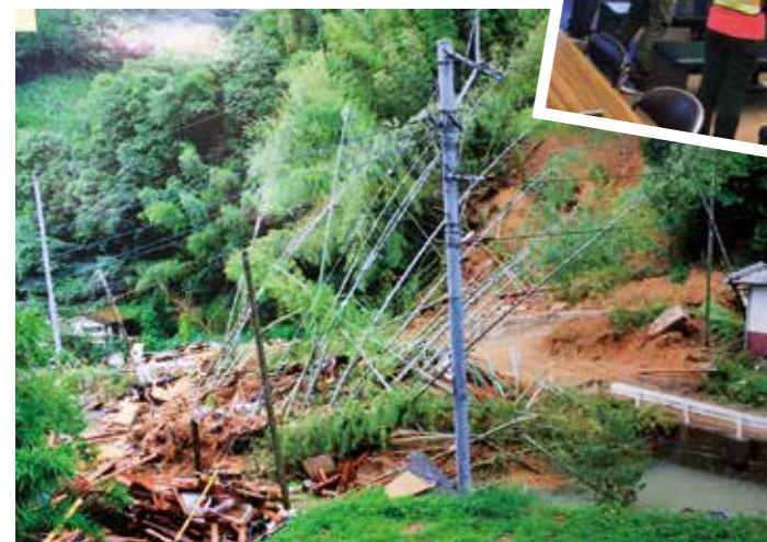
被災直後の芦北町の様子