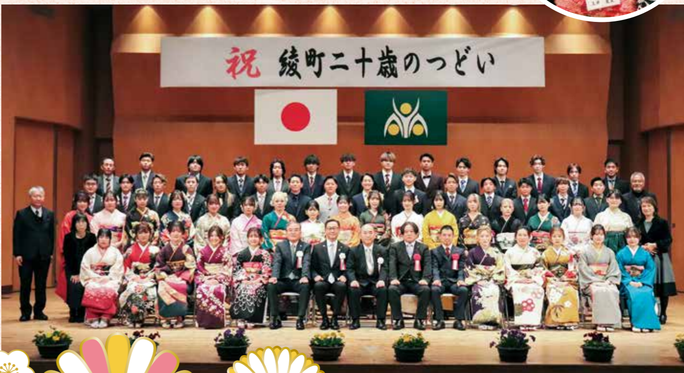
55人の二十歳の皆さんと恩師の方々