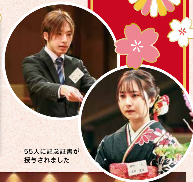
55人に記念証書が授与されました