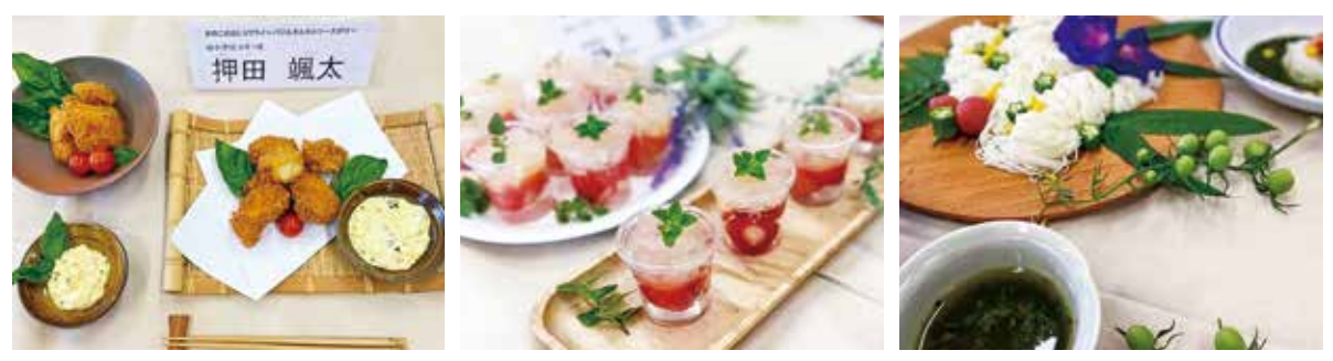
左から「きのこのおしりフライ~バジルタルタルソースがけ~」「綾のくだものプルプルゼリー」「ひんやりモロヘイヤそうめん」

子どもたちのアイデア料理をどうぞお楽しみに! なお、料金や営業時間など詳しくは各店舗にお問い合わせください。また、レシピは手づくりほんものセンターの店舗内ラックで配布しています。ご家庭で活用してみたいかがでしょうか。