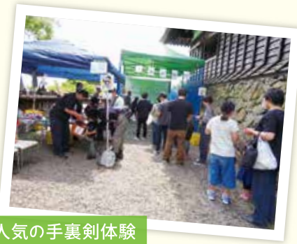
人気の手裏剣体験