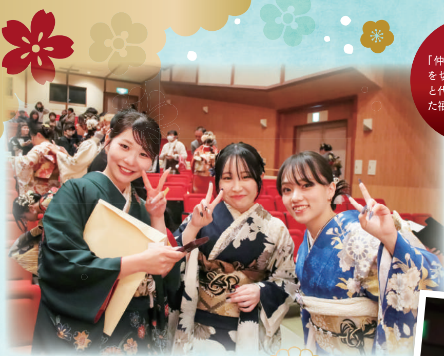
晴れ着に身を包み笑顔で旧友と再会