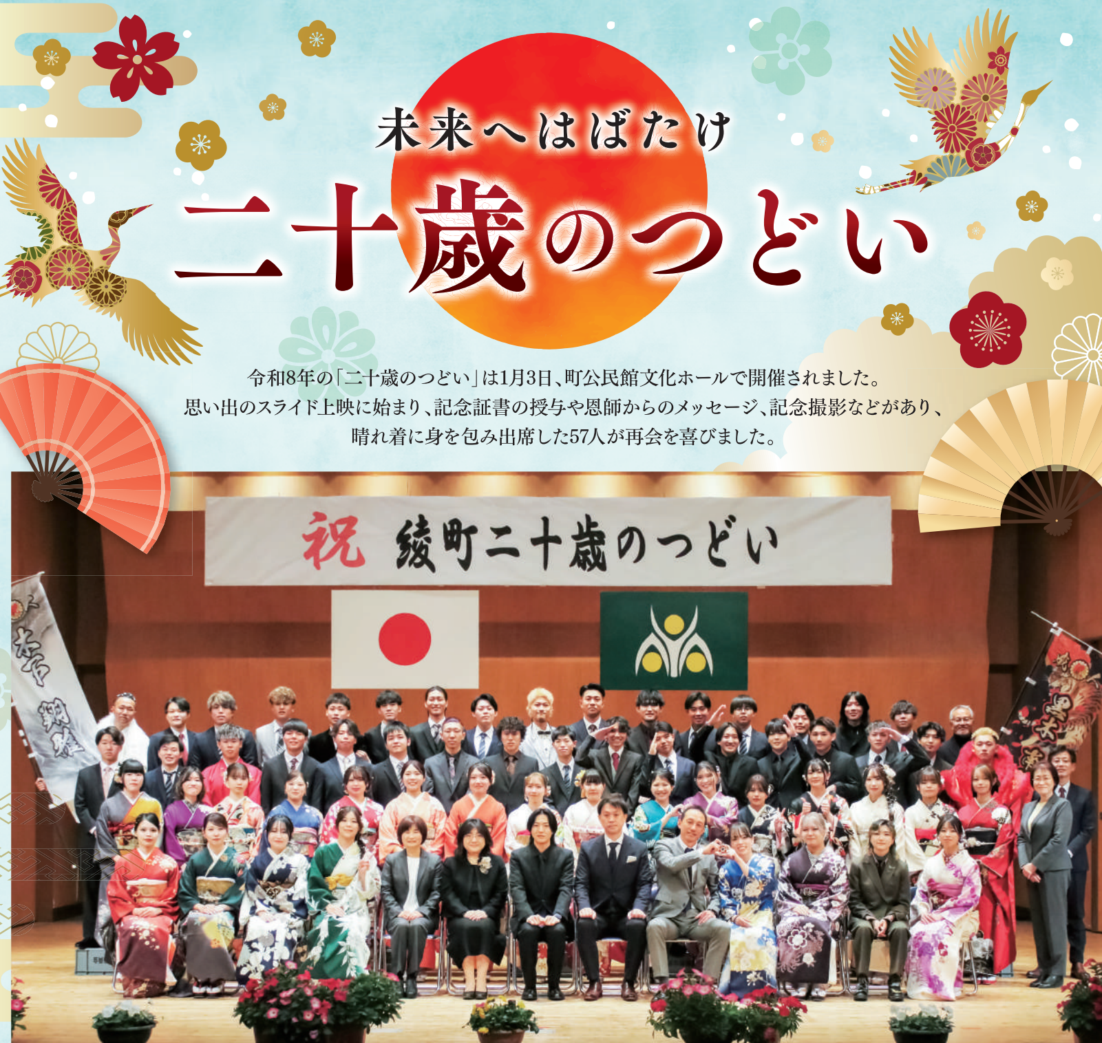
恩師とともに記念撮影