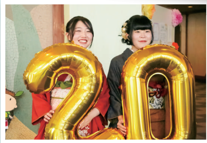
旧友や家族と記念撮影する姿があちこちで見られました