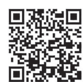
確定申告書等 作成コーナー

所得税の確定申告ができます。パソコンの場合は「確定申告」と検索、スマートフォンの場合は二次元コード「確定申告書等作成コーナー」を読み取り、マイナンバーカードを使って申告。マイナポータルと連携すると、確定申告書の該当項目を自動で入力することができます。