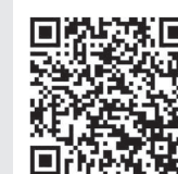
個人住民税電子 申告システム

マイナンバーカードを使って、地方税の手続きがインターネットでできるシステムです。役場に出向かなくても自宅で簡単に住民税の申告ができます。右の「個人住民税電子申告システム」の二次元コードを読み取ってご利用ください。