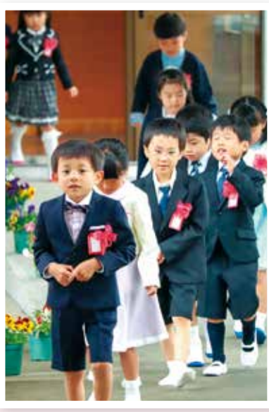
ドキドキワクワクの新1年生