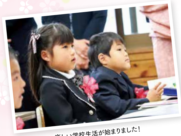
楽しい学校生活が始まりました!

■ 綾小学校／卒業式 3月25日 73人、入学式 4月14日 43人 ■ 綾中学校／卒業式 3月16日 64人、入学式 4月9日 75人