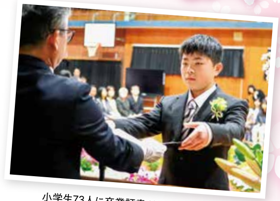
小学生73人に卒業証書が手渡されました。