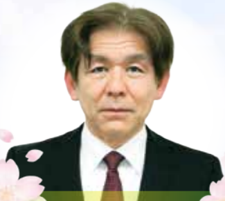
校長 由浅 公章 前任地 えびの市教育委員会